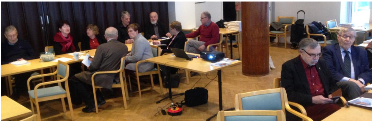
Seminariet Åldras tryggt ordnades i Åbo i februari.